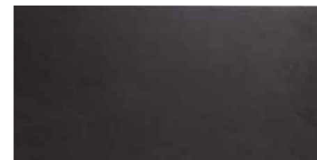
DU54 Senator Negro 30 x 60 cm.