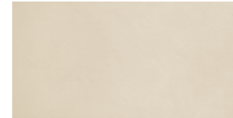
DU51 Senator Almond 30 x 60 cm.