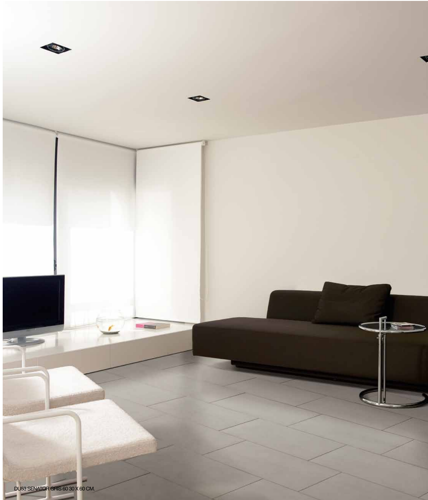
DU53 SENATOR GRIS 60 30 X 60 CM.

Conforme/According to/Conforme Gemäß/Conforme/ Соответствует Bla / UNE EN 14411 G