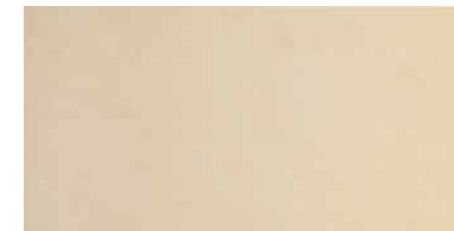
DU52 Senator Beige 30 x 60 cm.