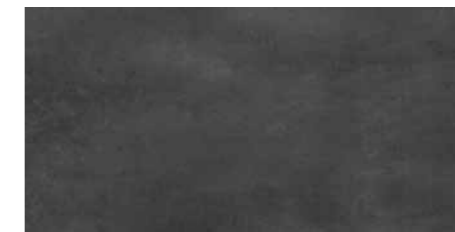
DU83 Concret Black-S 30 x 60 cm.