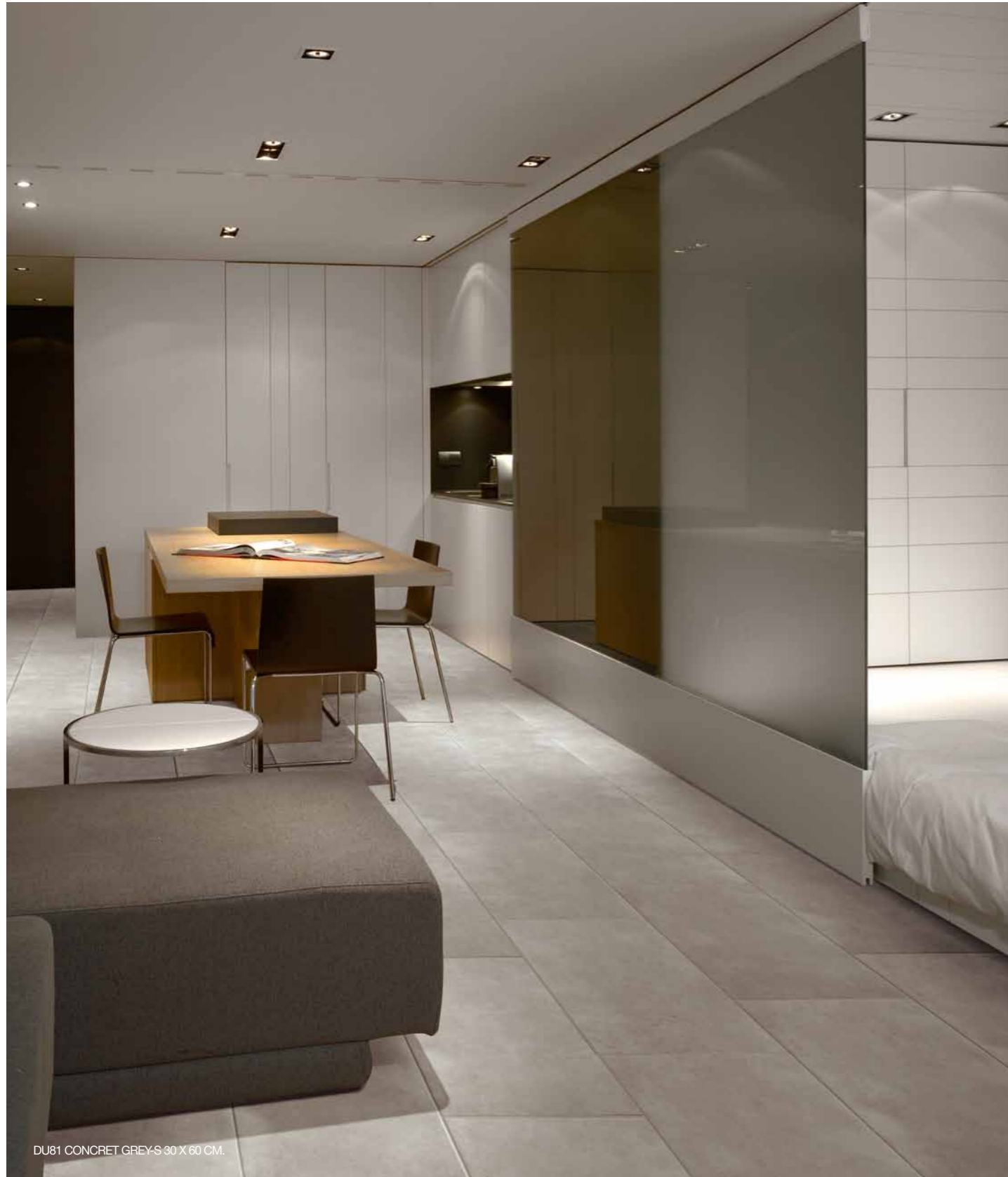
DU81 CONCRET GREYS 30 X 60 CM.

Conforme/According to/Conforme Gemäß/Conforme/ Соответствует Bla / UNE EN 14411 G