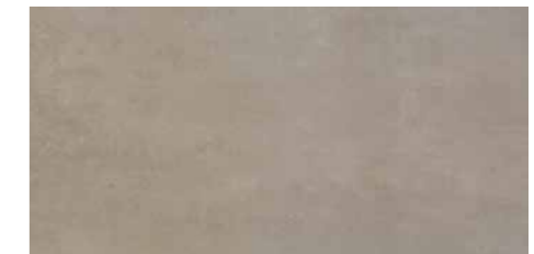
DU82 Concret Smoke-S 30 x 60 cm.