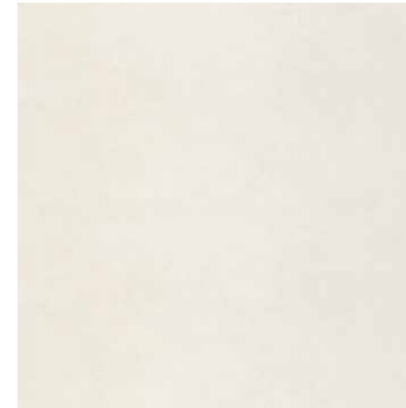
D103 Concret-White 60 x 60 cm.