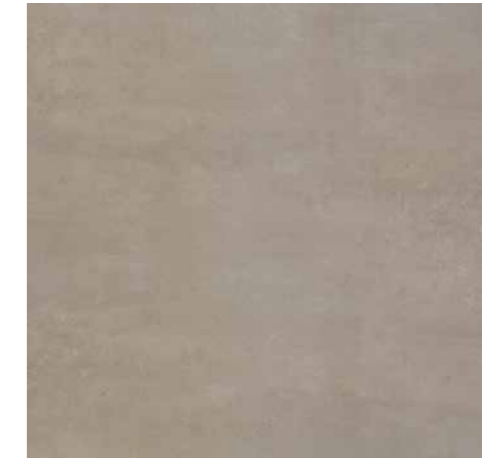
D105 Concret-Smoke 60 x 60 cm.