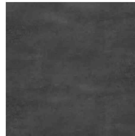
D106 Concret-Black 60 x 60 cm.