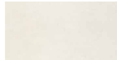
DU80 Concret White-S 30 x 60 cm.