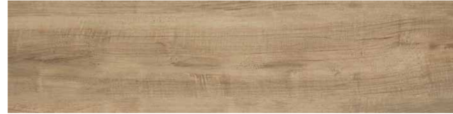
DBVA Irati Rt-Ulivo 30x120 cm.