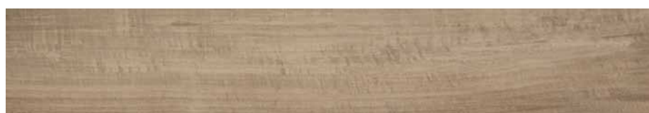
DBVF Irati Rt-Acero 20x120 cm.