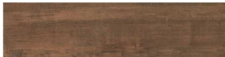
DBVC Irati Rt-Noce 30x120 cm.