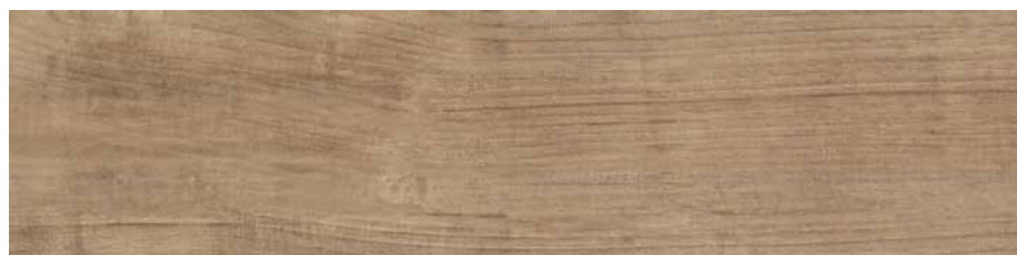
DBVB Irati Rt-Acero 30x120 cm.

PORCELÁNICO / PORCELAIN / GRÈS CERAM FEINSTEINZEUG / GRES PORCELLANATO PORCELANICO / КЕРАМОГРАНИТ