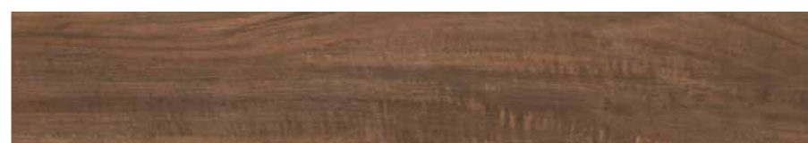
DBVG Irati Rt-Noce 20x120 cm.