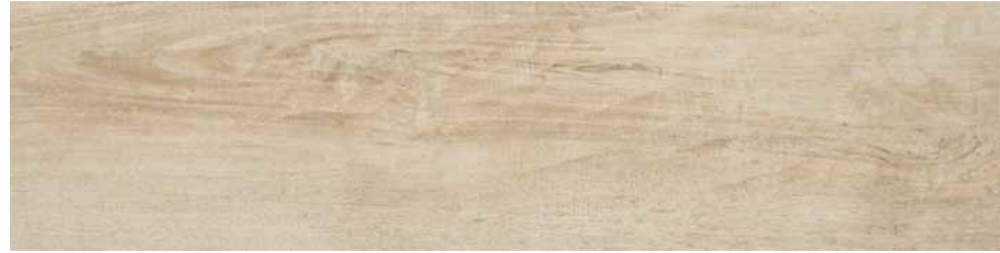
DBUZ Irati Rt-Faggio 30x120 cm.

PORCELÁNICO / PORCELAIN / GRÈS CERAM FEINSTEINZEUG / GRES PORCELLANATO PORCELANICO / КЕРАМОГРАНИТ