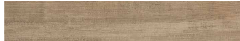
DBVE Irati Rt-Ulivo 20x120 cm.