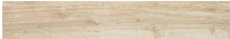
DBVD Irati Rt-Faggio 20x120 cm.